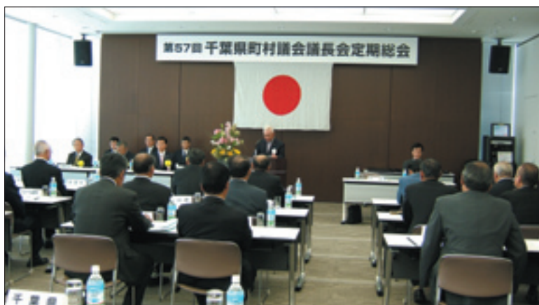
千葉県町村議会議長 定期総会