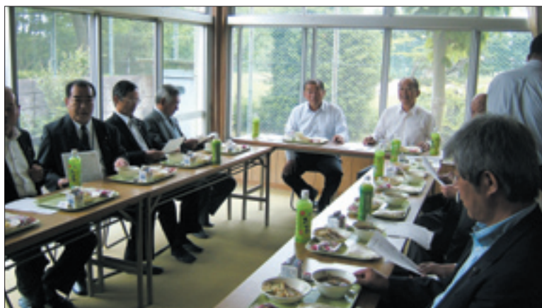
全員協議会時の 給食試食