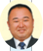
堀越 保夫 議員