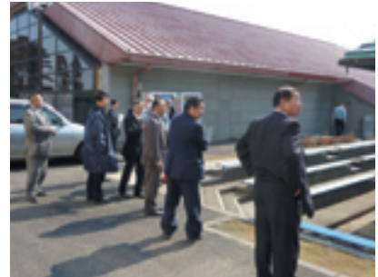
農業者トレーニングセンター