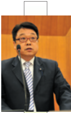
伊橋 寿夫 議員

それ以外の各地区、通学道路等の測定の監視については、測定器の貸し出しと併せまして、調査方法を関係課と協議して連携を図りながら検討していきたいと考えます。