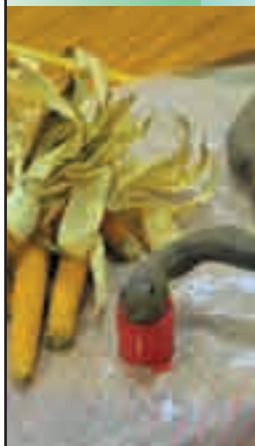
さつまいもで作ったヘビのオブジェ (むくろじ祭)