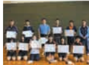
各部門の入賞者の皆さん