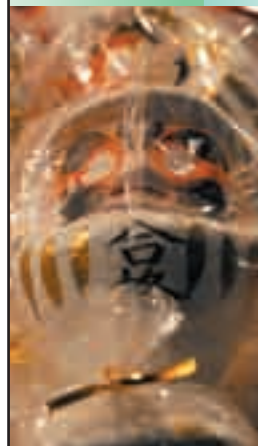
春まであと少し がんばれ！受験生