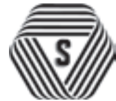
厚生労働大臣認可

法律で定められた消費者(利用者)擁護に資するための制度です。厚生労働大臣の約款に従って営業することを登録した「理容店」、「美容店」、「クリーニング店」、「めん類飲食店」、「一般飲食店」では、店頭に安心・清潔・安全を約束するSマークを掲げています。万一の場合には、事故賠償基準に基づいた補償が受けられます。