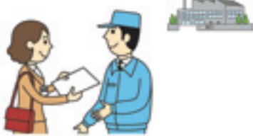
経済産業省・千葉県・市区町村

調査結果は、国や地方公共団体の行政施策の重要な基礎資料として利用されるとともに、企業、大学などでの研究資料、小・中・高等学校の教材など、広く利用されています。12月中旬から1月にかけて調査員が「調査員証」を携帯してお伺いしますので、ご回答をよろしくをお願いします。