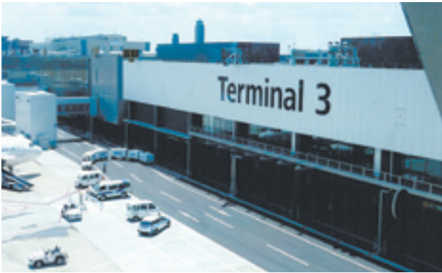
LCC専用第3ターミナル視察