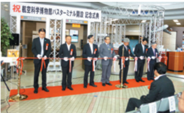
航空科学博物館バスターミナル開設