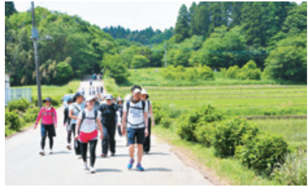
豪足を楽しむツデーマーチ