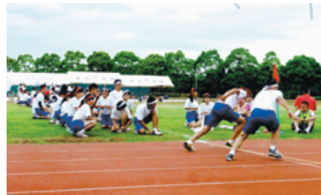
中学校体育祭 男女混合リレー