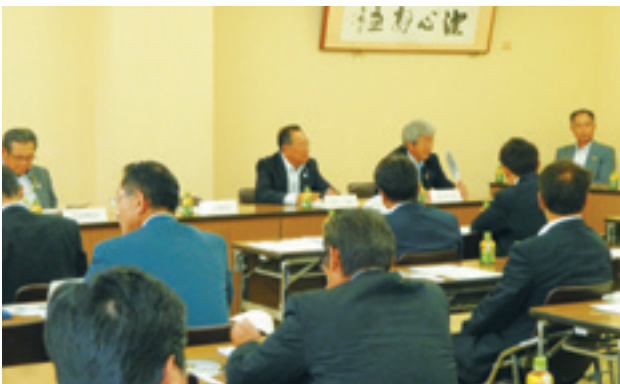
芝山町・多古町議会連絡協議会総会