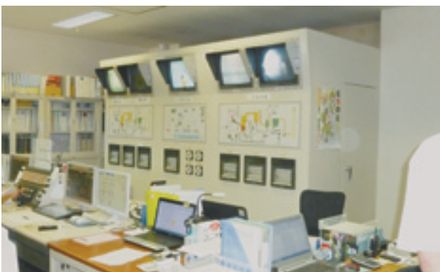
山武郡市環境衛生組合施設視察