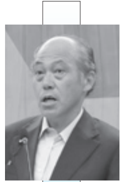
小嶋 秀樹 議員