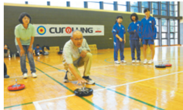
勝負でも和気あいあいカローリング大会