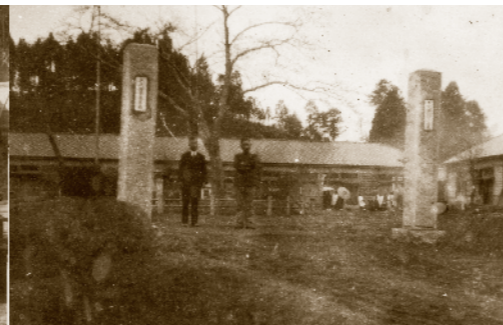
千代田尋常小学校校門