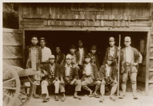
菱田中郷消防団(昭和22年)