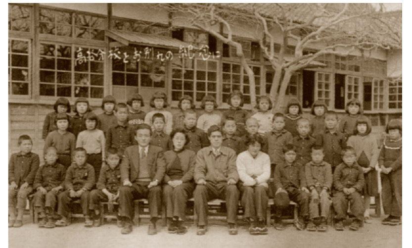
芝山小学校第一分校(高谷)