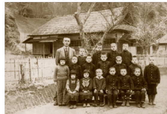
芝山小学校第二分校(大台)