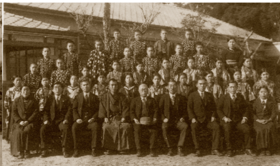
千代田尋常高等小学校