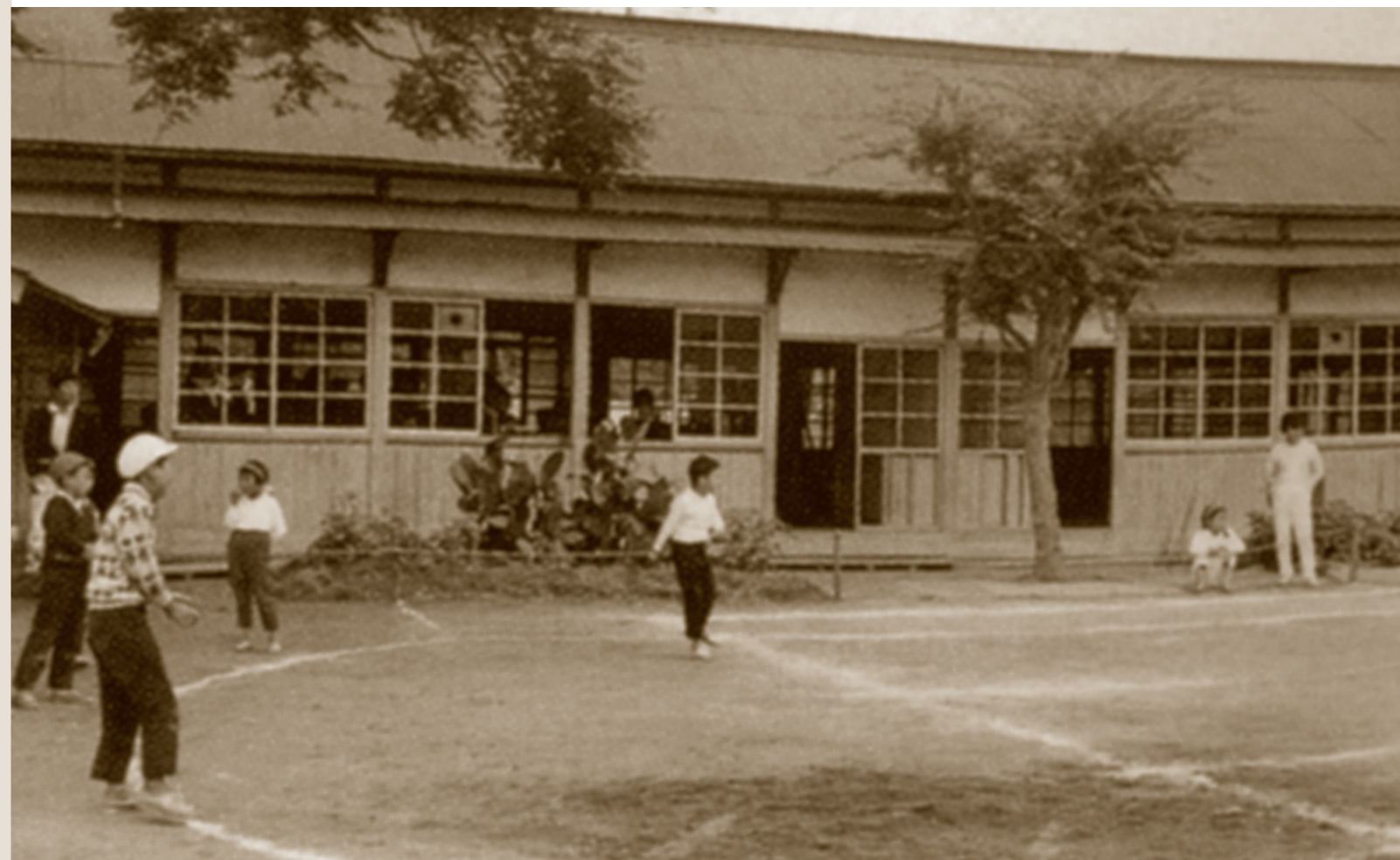
芝山小学校第三分校(高田)