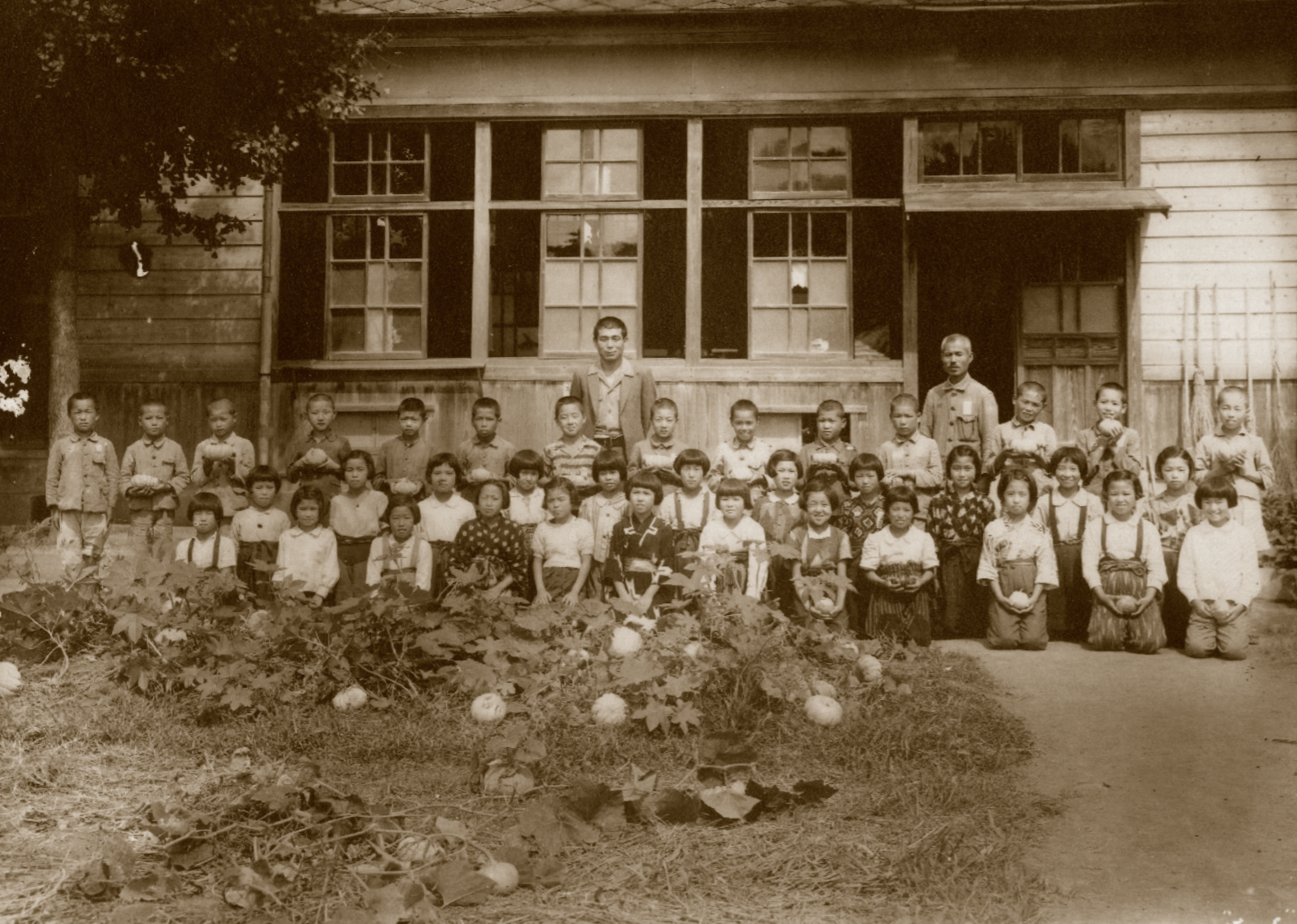
食料として栽培していた南瓜を前に(昭和20年)