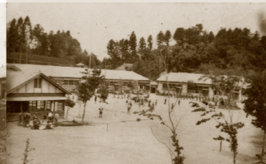
千代田尋常小学校全景