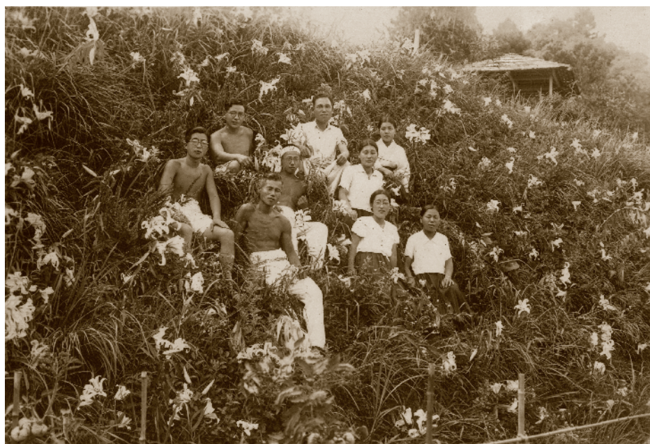
千代田小学校裏土手で食料のためのゆりに囲まれて