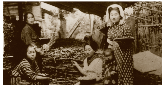
養蚕の伝習作業(昭和初期)