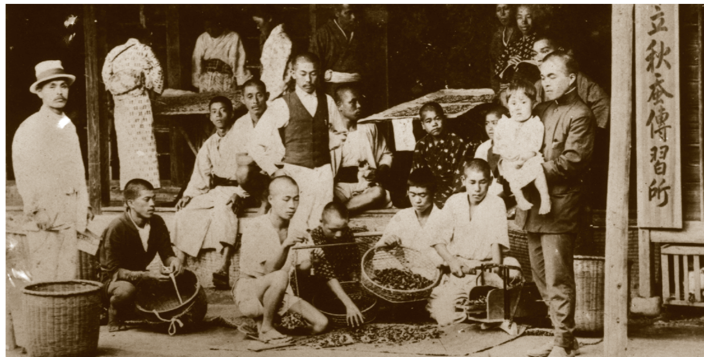
養蚕の伝習所(昭和初期)