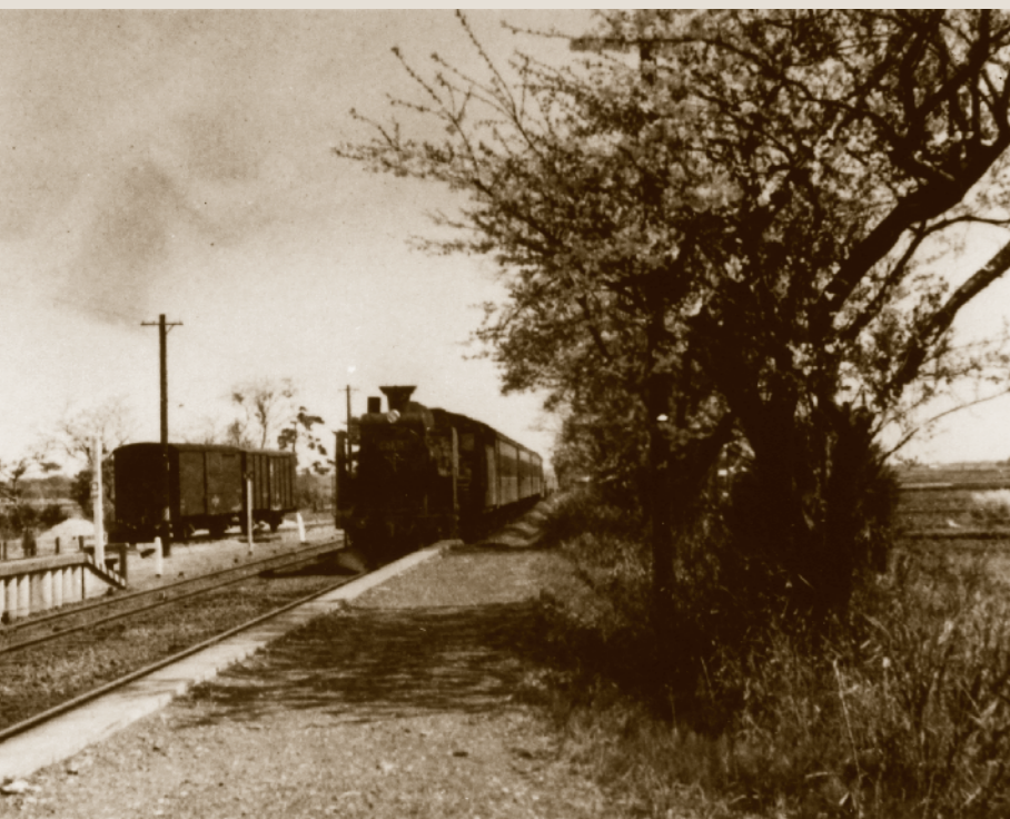
軽便鉄道花見の臨時列車(昭和16・17年)