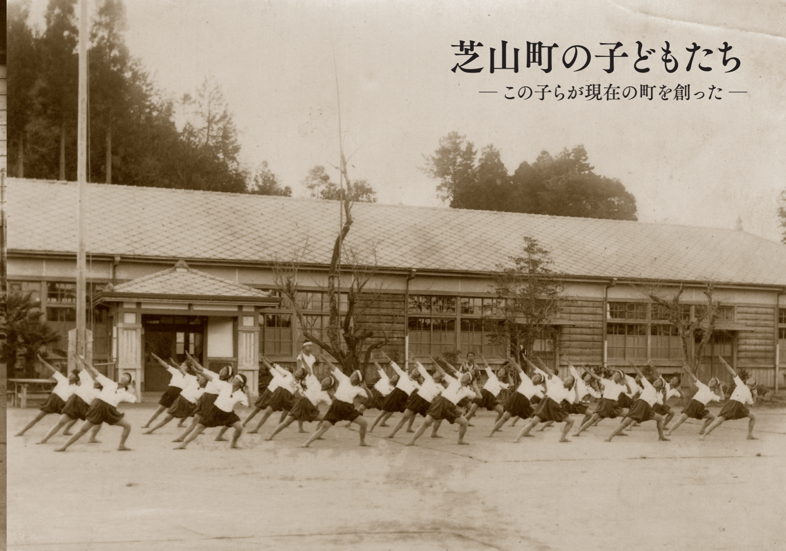
千代田尋常高等小学校体育授業