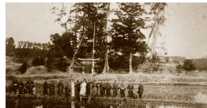
下吹入隣高神社の祭礼(明治40年代)