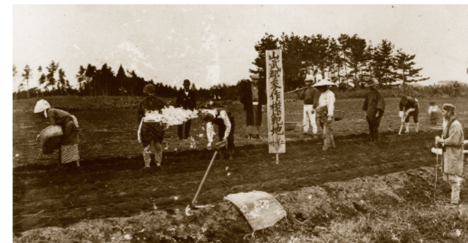
麦をまく(大正初期)