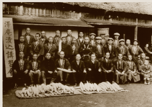
沢庵の漬込み(昭和8年)