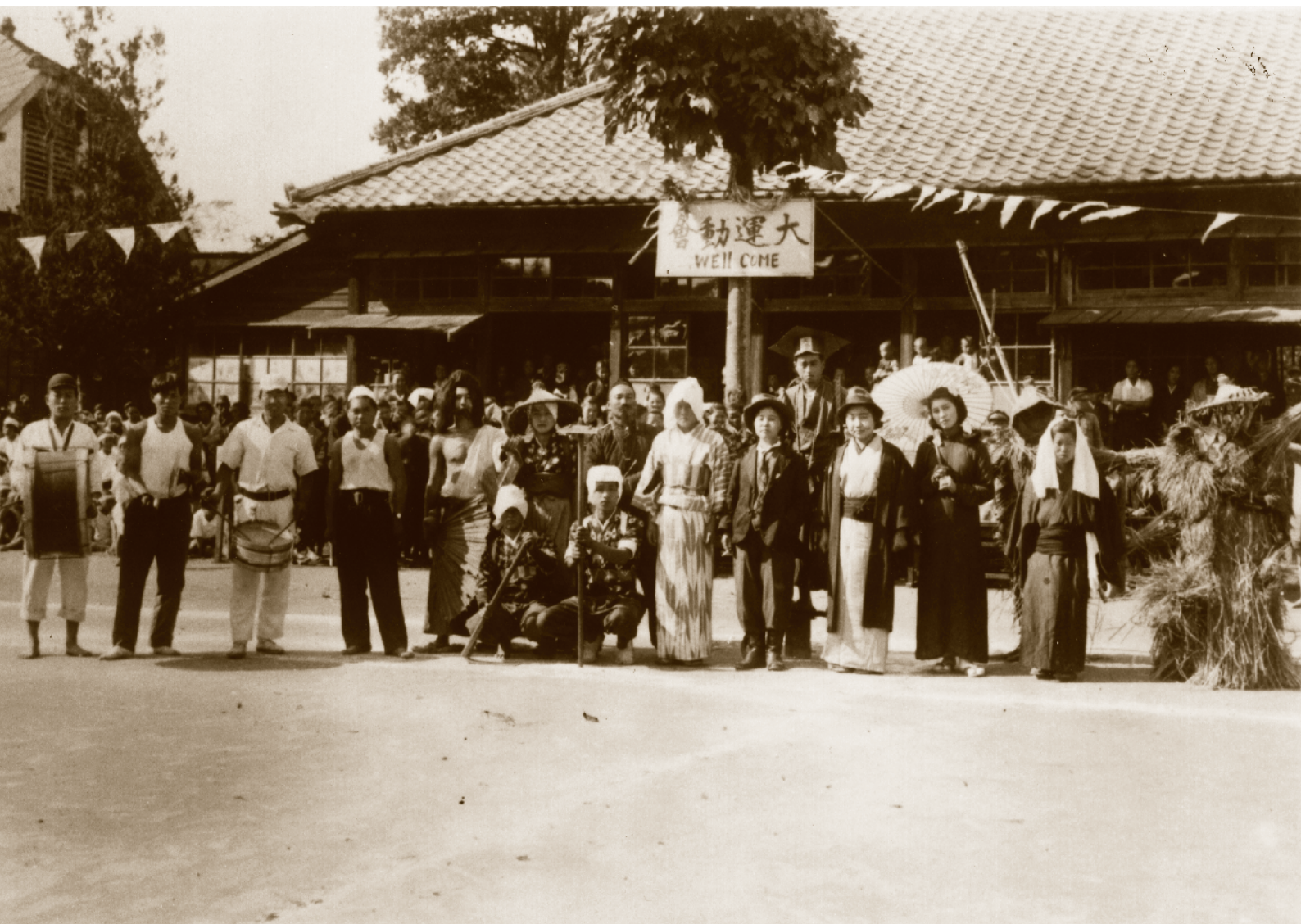
大運動会仮装行列(昭和21年)

空港ができる前の芝山町民たちはどのような暮らしをしていたのだろう。古い写真たちが喚起する芳しい思い出。