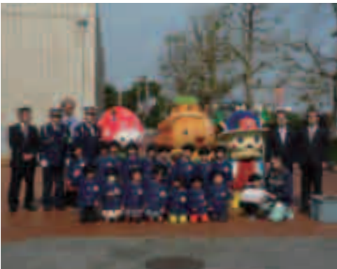
春の交通安全運動出動式にしばっこくん参加（4月6日）

A 年度（4月から翌年3月）ごとに計算して決められます。年度の途中で加入人数が変わったり、前年の総所得金額が変更になったりしたときなどは、再度計算します。