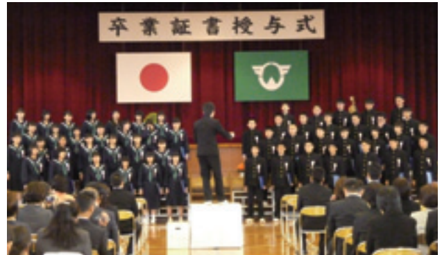
芝山中学校卒業式