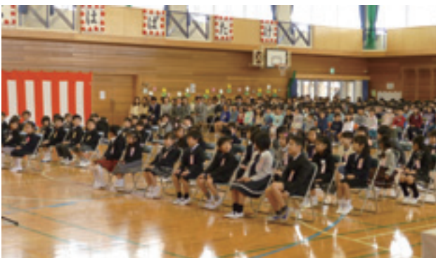
芝山小学校入学式