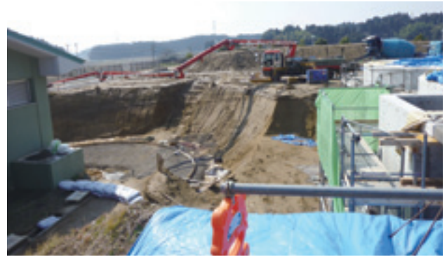
芝山クリーンセンター