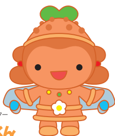
芝山町キャラクター しほんく

答 【町長】私も課題解決の最良の方法は対話だと考えます。町民の意見は宝、これをモットーに行政運営を行っていきま