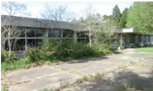
旧高等技術専門学校(牧野)