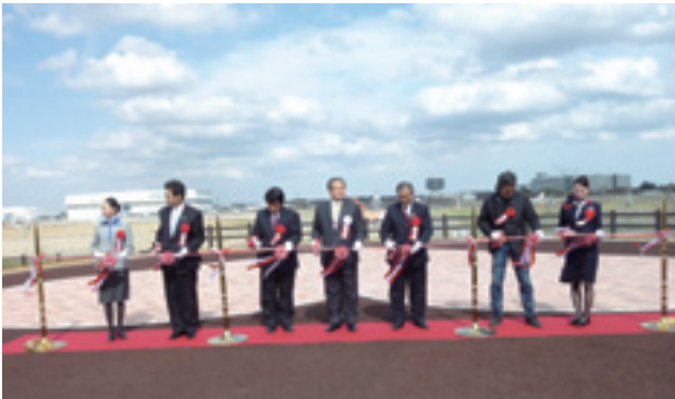
ひこうきの丘完成式