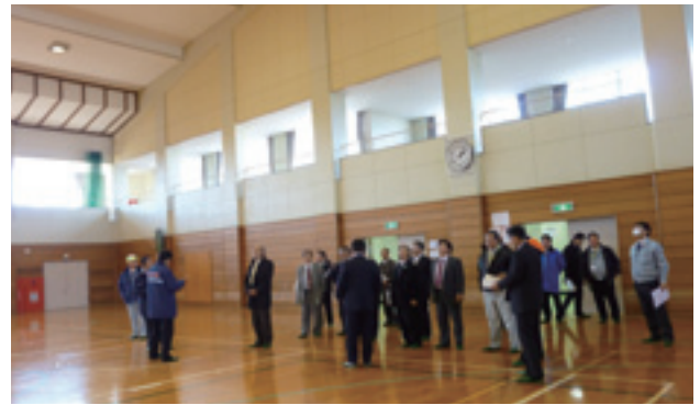
芝山中学校屋内運動場改修工事