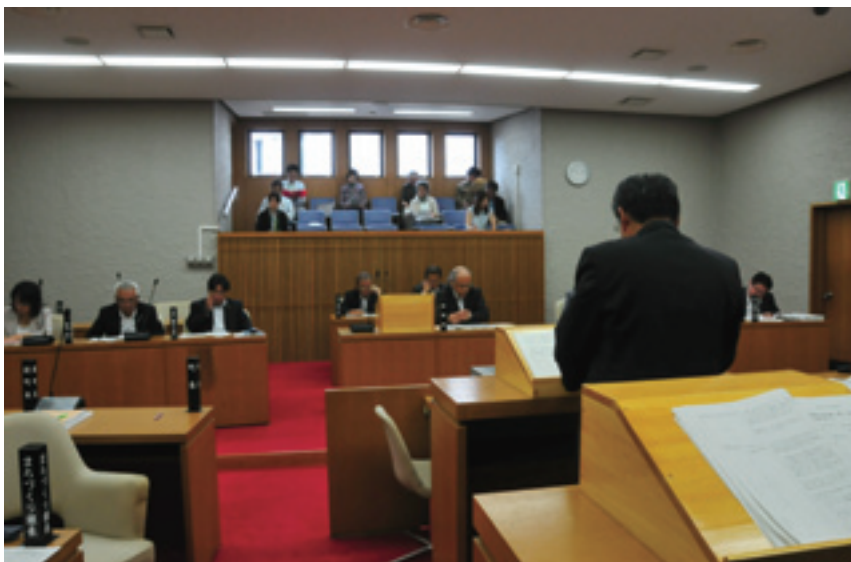
☎ 総務課 行政係 ☎ 77-3901

6月7日から10日にかけて開催された平成28年第2回芝山町議会定例会。上程された議案6件は、審査の結果全て可決されました。