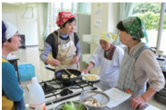
お手軽メニューを楽しく料理 (6月2日 はつらつクッキングサロン)