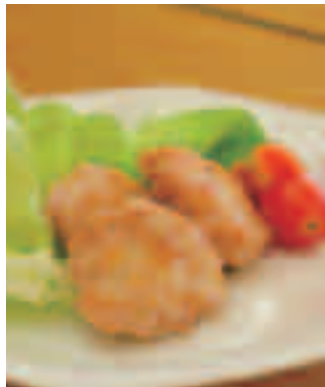
今年は米粉がどんな料理になるのかな？