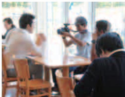
タイの人気番組「すごいジャパン」が来町（10月27日）