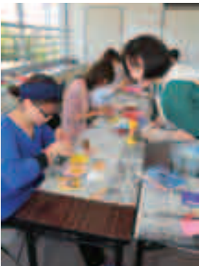
3月13日 名札作りの様子