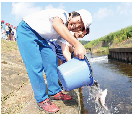
美しい木戸川を守る会川魚放流事業（10月12日）

なお、平成29年中に納付した国民年金保険料について、社会保険料控除を受けるには、年末調整や確定申告を行うときに、領収証書など保険料を支払ったことを証明する書類の添付が必要になります。このため、平成29年1月1日から9月30日までの間に国民年金保険料を納付された方には、11月上旬に日本年金機構から「社会保険料（国民年金保険料）控除証明書」が送られますので、申告書の提出の際には必ずこの証明書または領収証書を添付してください（平成29年10月1日から12月31日まで