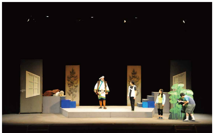
小学校芸術鑑賞教室

されました。また、第2部ではプロのアーティストによる演奏、芝山町・NAA混声合唱団による合唱が行われ、素晴らしい歌声が響き渡りました。