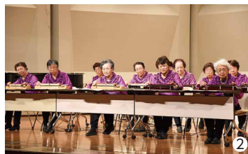
①芝山町・NAA混声合唱団 ②大正琴の演奏

12月16日、文化センターを会場に行われた「第36回クリスマス音楽会」。第1部では日々練習を積み重ねてきたピアノ、芝山小金管部の演奏など幅広いジャンルの曲目が発表