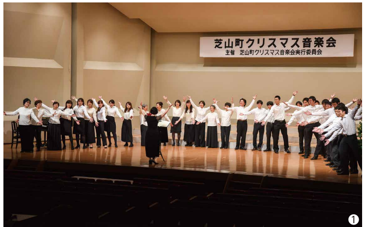
芝山町クリスマス音楽会 主催 芝山町クリスマス音楽会実行委員会