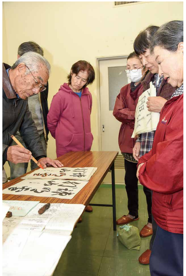
2017年秋季昇級試験の作品選考風景