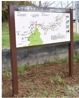
町内に山中古道の看板が設置されました

A: 年度（4月から翌年3月）ごとに計算して決められます。年度の途中で加入人数が変わったり、前年の総所得金