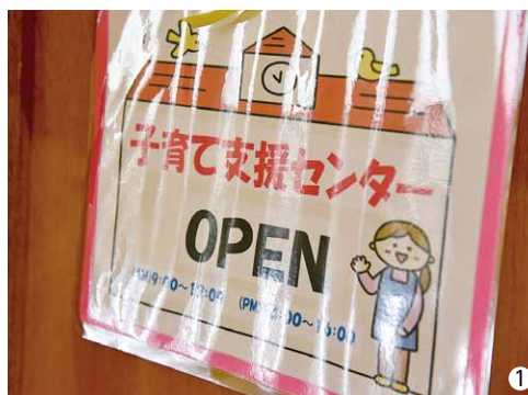
①福祉センター「やすらぎの里」1階静養室にて開設 ②おもちゃがたくさん！いっぱい遊べて楽しいなあ～