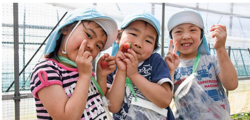
保育所のいちご狩り（5月15日）

高齢者の皆さまの心身の状態やその変化に合わせて、とぎれることなく必要なサービスが提供されるように介護支援専門員（ケアマネージャー）への指導・助言や医療機関などの関係機関との調整を行います。