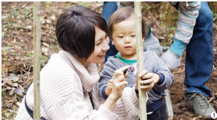
山ゆり球根植え付けイベント

11月13日、上吹入地区の相馬高神社にて「上吹入宮祭り」が行われました。集会所での直会 なわらい の一幕では、お面と大根を持った2人が「よいやさっさ、よいさっさ」の掛け声に合わせて参加者の顔に次々と大根に付けた墨を塗っていきます。五穀豊穡と子孫繁栄を祈願して行われている伝統ある行事、地元の方々はその伝統を代々引き継いでいます。