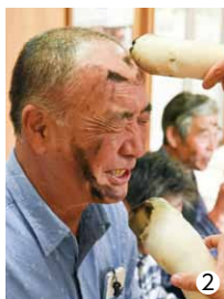
①②顔に大根を塗られる参加者の皆さん

11月13日、上吹入地区の相馬高神社にて「上吹入宮祭り」が行われました。集会所での直会 なわらい の一幕では、お面と大根を持った2人が「よいやさっさ、よいさっさ」の掛け声に合わせて参加者の顔に次々と大根に付けた墨を塗っていきます。五穀豊穡と子孫繁栄を祈願して行われている伝統ある行事、地元の方々はその伝統を代々引き継いでいます。