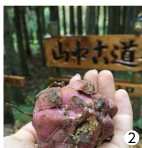
①竹プレートに名前を記入する参加者 ②山ゆりの球根

11月11日、山中古道にて「山ゆり球根植え付けイベント」が行われました。参加者の皆さんは、自ら地面を掘って山ゆりの球根を植え付けし、自身の名前を記入した竹プレートを立てかけました。乾燥と暑さに弱く半日陰を好む山ゆりは、7月上旬～中旬が開花時期とのことで、自分たちで植えた山ゆりが無事に開花することを参加者全員で祈りました。