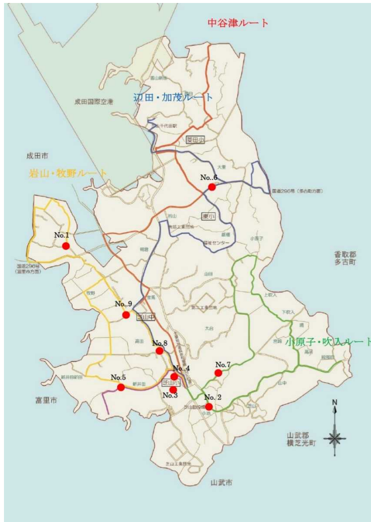
点検実施箇所地図