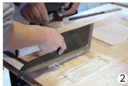
①そば打ち体験中の参加者の皆さん ②難しいそば切りに挑戦

3月31日、道の駅風和里しばやま(以下「風和里」。)の店舗脇イベント小屋において、風和里主催の「そば打ち体験」が開催されました。当日は、芝山町手打ちそばの会の皆さんが講師として招かれ、参加された方たちはマンツーマン指導によりそば打ちを体験しました。慣れないそば打ちに悪戦苦闘するも最後はみんなで上手にそばを打つことができ、達成感と笑顔あふれる1日となりました。