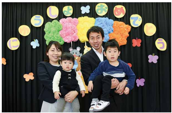
4月5日 第二保育所入所式

春色に染まった暖かな4月。 期待と不安で胸が高鳴る式の当日に、子どもたちが元気いっぱい新たなステージへの一歩を踏み出しました。