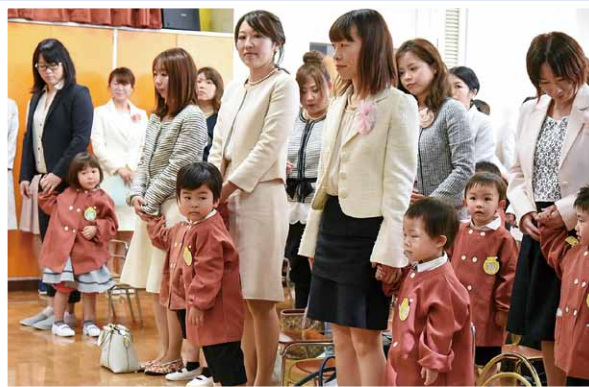
4月11日 みつば幼稚園入園式