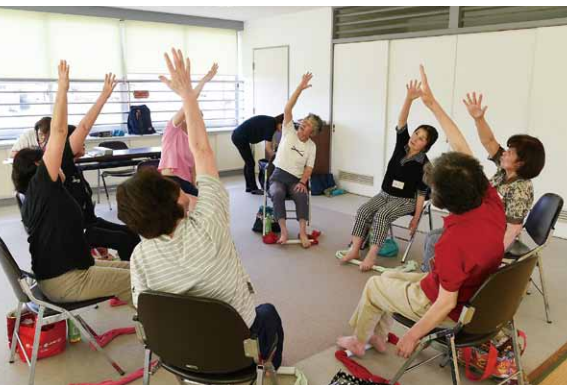
平成30年度の「元気塾」の様子