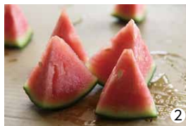
①真剣なまなざしで現品査定をする部会の方たち ②食味検査として切られた西瓜

4月12日、JA山武郡市芝山経済センターにおいて「平成31年産小玉西瓜目揃会」が行われました。今年の小玉西瓜の出荷規格(A~C)を定めるべく、二川西瓜部会の皆さんが集まり、査定に出された小玉西瓜の傷の具合や大きさ、食味などが検査されました。出荷規格が定まったこの日、生産者の皆さんの出荷に向けたシーズンがいよいよ始まりました。