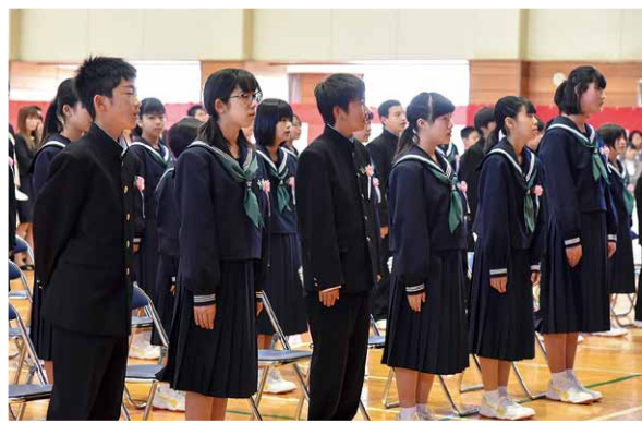
4月9日 中学校入学式