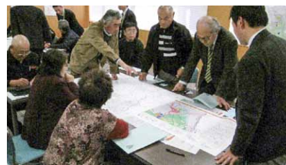
第1回住民説明会の様子