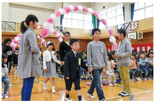
4月10日 小学校入学式