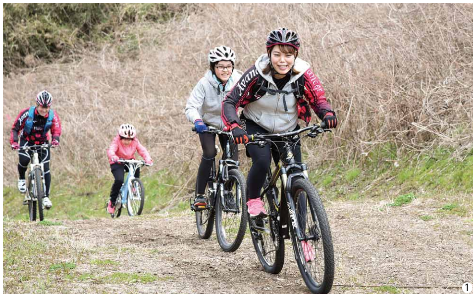
①②町内各所を走る参加者の皆さん ③マウンテンバイクの乗り方を教わる参加者の皆さん