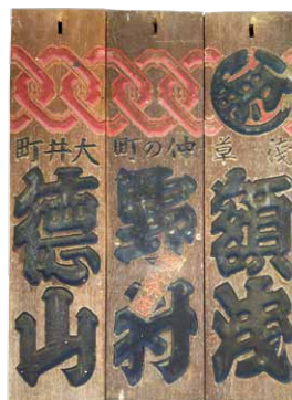
▲藤屋旅館の講中札