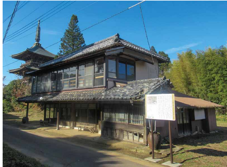
▲今も残されている旧笹喜旅館と観音教寺三重塔

入館料：大人200円、子ども100円（小中学生）、団体料金（20人以上）大人150円・子ども70円（小中学生）、65歳以上の方140円、障がい者とその介護者無料（入館時に手帳をご提示ください）