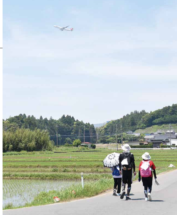
▲豊かな自然と頭上を飛ぶ飛行機の迫力が味わえます