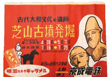
▲芝山古墳発掘の京成電鉄広告