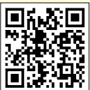
(町ホームページQRコード)

なお、代替イベントとして「芝山公園イルミネーション2020」を開催します。開催日程など詳細は、町ホームページをご覧ください。