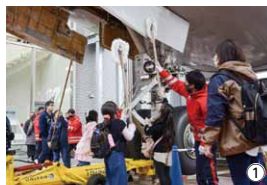
業務に実際に携わっているスタッフから体験を交えてさまざまなお話を聞くことができました！

11月29日(日)に「JGSグランドハンドリング教室(写真①)」、12月6日(日)に「集まれ！NARITA空港車輦(写真②)」が開催されました。