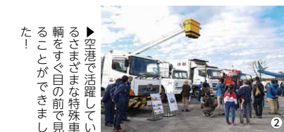
▶空港で活躍しているさまざまな特殊車輦をすぐ目の前で見る事ができました！