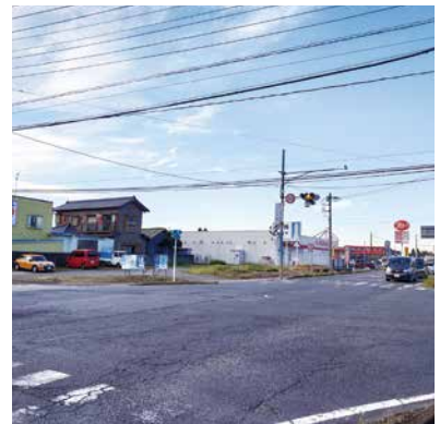
▲小池をさらに賑わう商業地にできるのか