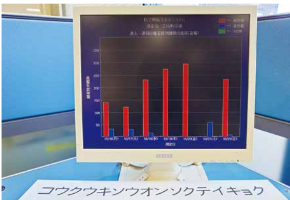
▲騒音のモニタリング風景

答 【企画空港政策課長】各地域から、騒音測定の実施、騒音対策事業の強化、移転補償地域の見直し等の要望を受けています。