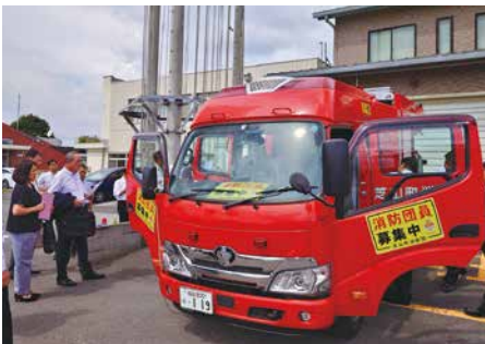
▲活躍が期待される第一分団の新型水槽車