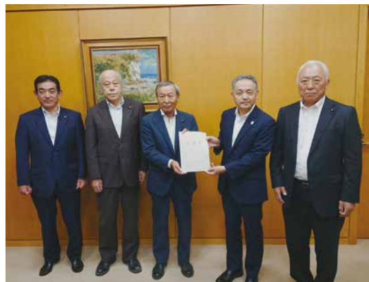
▲決議書を手渡す議員団

7月10日に成田空港周辺市町議会連絡協議会総会で了承された「成田空港の更なる機能強化に関する決議書」が8月1日、成田国際空港(株)に提出されました。また、8月4日に千葉県、8月10日に国土交通省航空局にも同決議書が提出され、機能強化の早期実現に向け周辺市町と千葉県との間で連携を図りました。