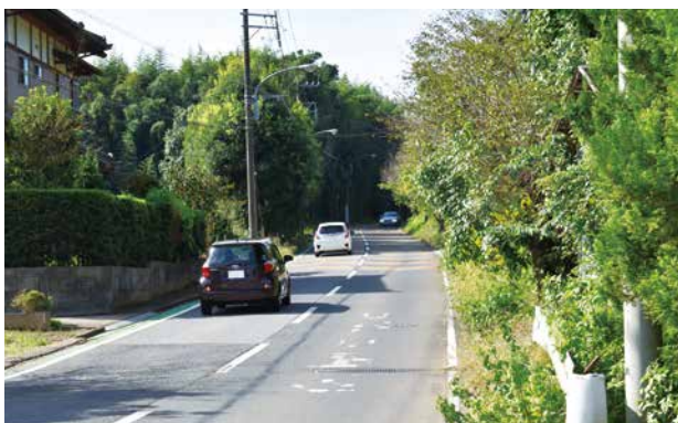
▲はにわ台につながる町道01-006号線

答 【町長】いつになるかはまだ決まっておりませんが、予算のめどが立てば進めます。はにわ台の坂はやりませので、どうかご理解ください。