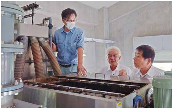
▲供用エリア拡大のため処理量が増大しているクリーンセンター。3軸目の汚泥脱水機が追加された。

全議員により構成された「決算審査特別委員会」で3日間合計14時間を費やして慎重審議した結果、令和4年度の町会計収支を認定しました。