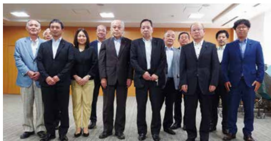
▲議会だよりを通じて有意義な交流ができました