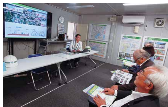
▲トンネル工事の詳細について丁寧な説明を受けました

芝山トンネルは、砂地の山のもろさが掘削に影響を与えたため、開通の延期を余儀なくされました。しかし、今回現場では新たな工法が追加され、再度開通の時期が見直されました。