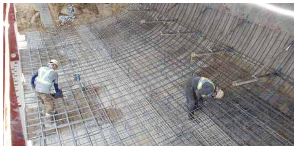
▲トンネル下部の補強作業