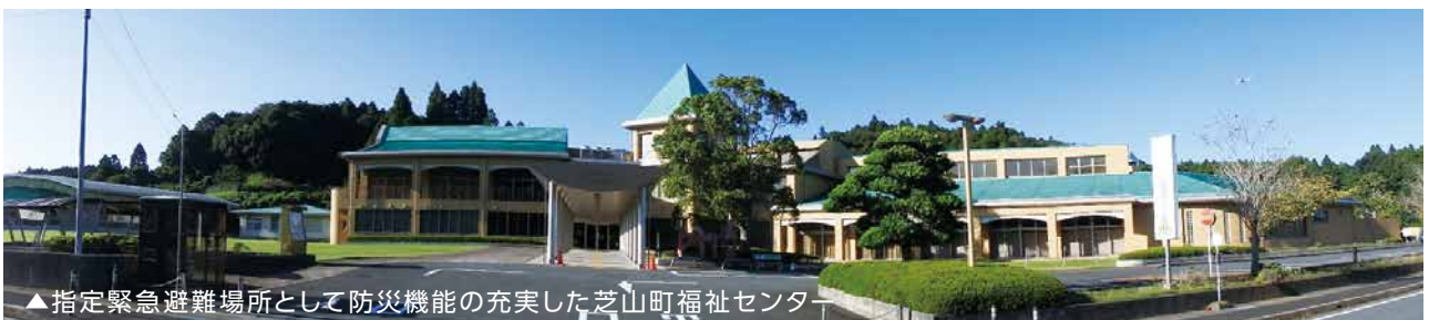
▲指定緊急避難場所として防災機能の充実した芝山町福祉センター

👉 【BCP】業務継続計画は、災害時に町役場そのものが被災し、職員、物資、情報等の利用できる資源に制限がある状況下において、優先的に実施すべき業務（非常時優先業務）特定し、業務の執行体制や対応手順、継続に必要な資源の確保等をあらかじめ定める計画。6要素、首長不在時の明確な代行順位、及び職員参集の体制、本庁舎が使用できなくなった場合の代替庁舎の特定、電気、水、食料等の確保、災害時にもつながりやすい多様な通信手段の確保、非常時優先業務の整理、重要な行政データのバックアップ。