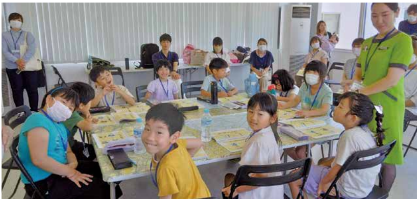
▲楽しく学ぶ英会話教室