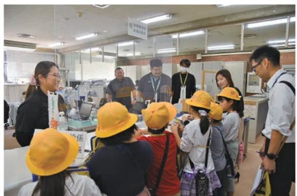
▲道路建設係地籍調査係では実際の道路の素材などに児童は興味津々