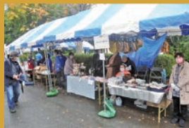
手をつなぐ親の会