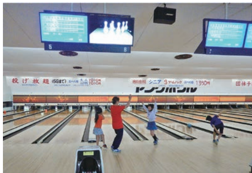
▲初めてボウリングを経験する児童もいましたが、相談員に教わりながら楽しくプレーしました