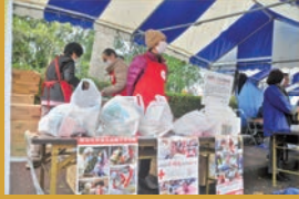
人権・行政・日赤