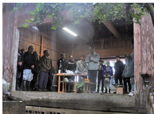
区長や役員方が代表し玉串を神様にお供えします

最後を惜しむ雨にも見守られながら、地域の守り神とともに新たな門出を迎える中谷津区の末永い、五穀豊穡、商売繁昌、家内安全などが祈願されました。