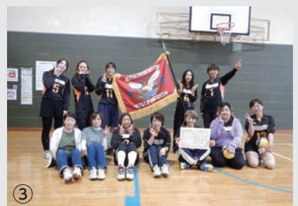
①力強いアンダーハンドサーブ ②高いジャンプで打つスパイク ③優勝したチーム「ミナミ」