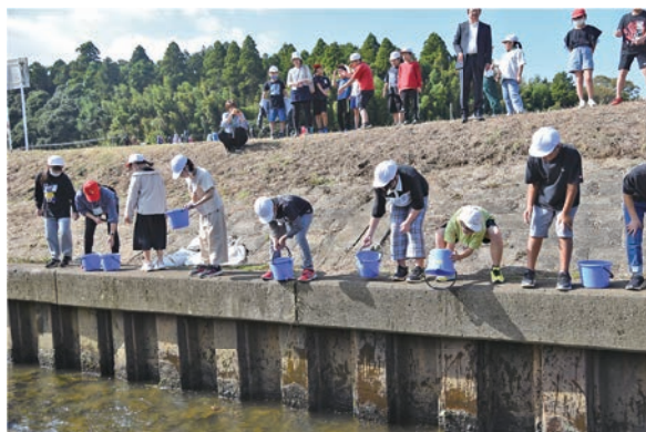
▲今後の成長に期待してフナを放流しました