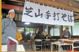
芝山手打ちそばの会