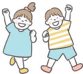
受付期限内の提出をお願いします

※風水害や地震などの災害の発生、感染症などの理由で小学校が休校となった際には、休所する場合があります。