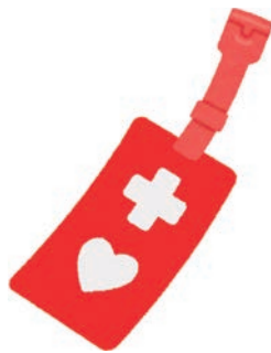
▲このマークを見かけたら、思いやりのある行動をお願いします。