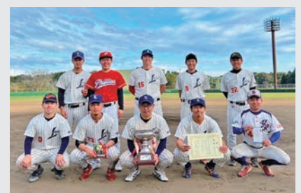
▲優勝した小池レイダースの皆さん

10月22日(日)、29日(日)に芝山公園野球場にて、秋季町民野球大会が行われました。今回は6チームが出場し、芝山町の野球を盛り上げました。決勝では小池レイダース対麒麟の試合で17対1で小池レイダースが勝利し、見事優勝しました。