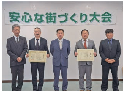
▲町の平和を守っていただいている功労者の皆さん