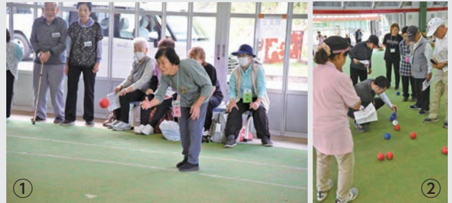
①団体種目の「ポッチャもどき」では中心に距離が近い一投が出る度に歓声があがりました。②距離が近い球が2つあり計測機を使っての判定もありました。

10月20日(金)、芝山町屋内ゲートボール場「すぱーく芝山」にて、あしたばシニア連合会運動会が開催されました。この運動会は高齢者がスポーツを通じ、健康の保持と会員相互の親睦を深めることを目的として行われました。