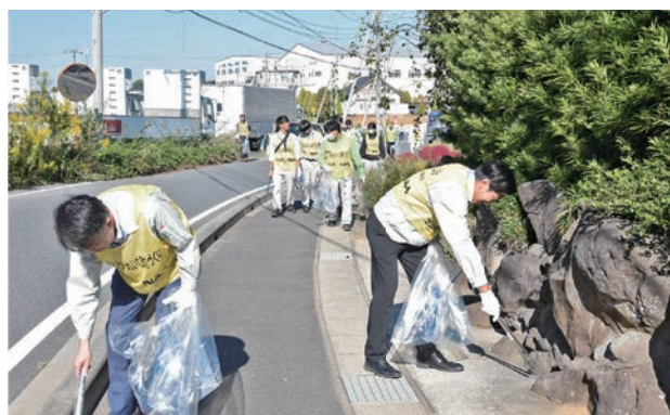
▲たくさんの方が参加しました

ボウリング大会では、得点で競わないオリジナルルールを適応しました。その後、空の駅風和里しばやまで行われたバーベキューでは、みんなで食材の調理や食事をして、参加者同士の交流がさらに深まりました。