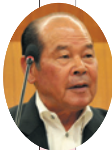
小山 久之 議員