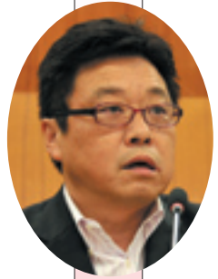
伊橋 寿夫 議員