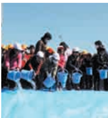
元気に帰ってきてね！ （3月6日、東小サケの稚魚放流）

③ 快適な生活環境の整備 合併浄化槽設置整備事業及び維持管理補助金、下水道事業特別会計繰入金公共下水道、農業集落排水事業