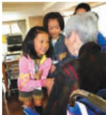
11月17日 菱田小学校二川苑訪問