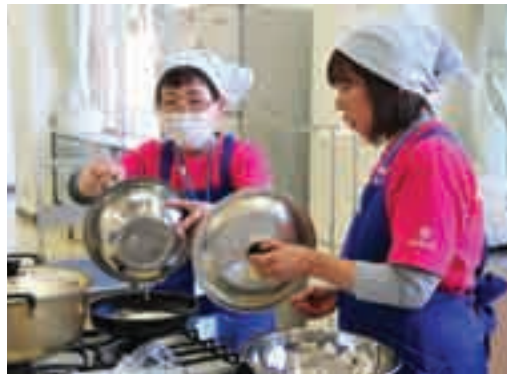
おいしい食事は健康づくりの第1歩 (1月29日 健康づくり講習会)