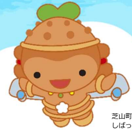
芝山町キャラクター しばこくん

どんな子育てをすればいいの？ 友達がほしい！ 親子で楽しくあそびたい！ 子育て中の情報がほしい！ そんな方々を子育て支援センターは応援しています。 一緒に楽しい子育てをしましょう♪ いつでもお気軽にお立ち寄りください。