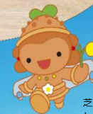
芝山町キャラクター しばこくん