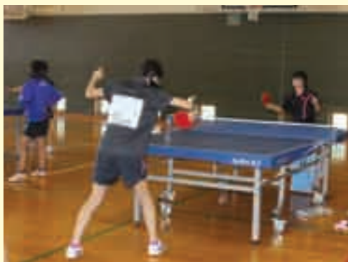
一球入魂で優勝目指せ！