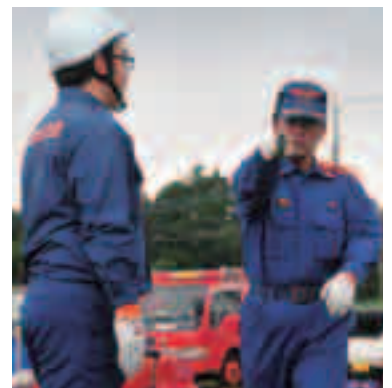
指導員の話に熱心に聞く

出場は小型ポンプ操法の部の6番目。雨が降る中行った演技の感想を聞くと「全然ダメでした。思っていたとおりの演技ができませんでした」と肩を落としてしまいました。結果は64点で第3位。