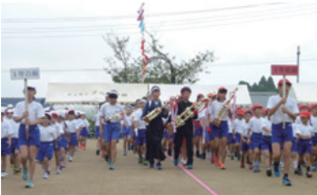
芝山小学校秋季大運動会