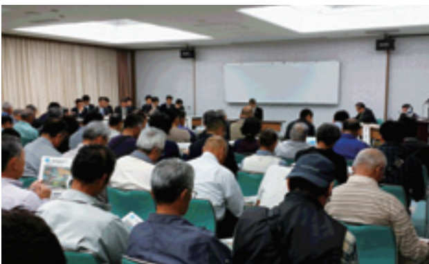
成田空港の機能強化町民説明会