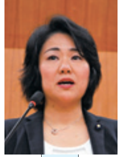
坂井 慶子 議員