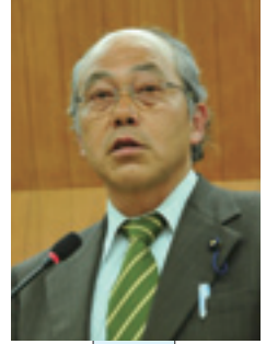
小嶋 秀樹 議員