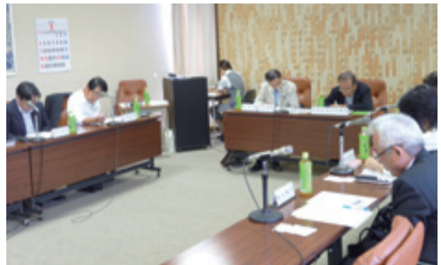
芝山鉄道延伸委員会