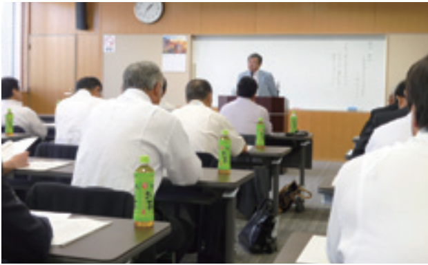
芝山町・多古町議会議員研修