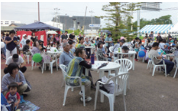
金曜元気市 (空の日フェスティバル)