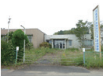
千代田共同利用施設