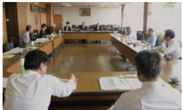
議会運営委員会視察研修