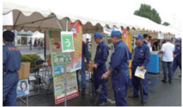
芝山町防災フェア