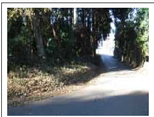
（中学校から来た道）