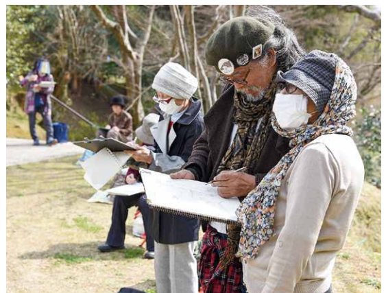
春の風に誘われて芝山仁王尊で写生 (3月15日 絵画会スケッチ)