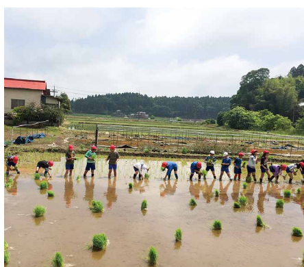
芝山小田植え体験（5月14日）

気軽にお茶を飲みながら情報交換ができる憩いの場として「認知症カフェ」の開催を検討しています（営利や宗教、政治活動を目的として行うものではありません）。 ※ボランティアと一緒に企画からお手伝いをしてくださる方を募集します。お気軽にお問い合わせください。