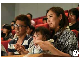
①盛り上がったステージイベント ②親子で楽しく観覧

6月2日、芝山文化センターにおいてNHK千葉放送局「みんなDEどーもくん！」の公開収録が行われました。どーもくんやその仲間たちがいろいろなパフォーマンスを披露し、客席の親子と一緒に遊んだりして会場を盛り上げました。