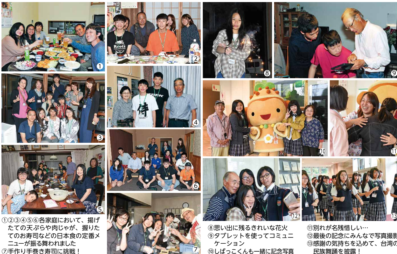
①②③④⑤⑥各家庭において、揚げたての天ぷらや肉じゃが、握りたてのお寿司などの日本食の定番メニューが振る舞われました ⑦手作り手巻き寿司に挑戦！