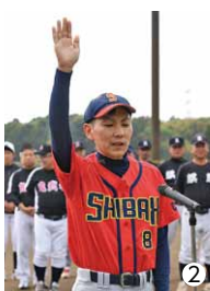
①優勝したJX-ANCIの皆さん ②力強い選手宣誓

5月12～26日、芝山公園野球場を会場に「第58回芝山町民野球大会」が開催されました。どのチームも拮抗した実力の中、JX-ANCIが昨年の雪辱を果たし2年ぶりの栄冠に輝きました。