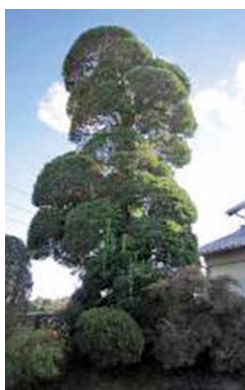
認定を受けたモチノキ

千葉県ホームページに公表されています。 《URL》 https://www.pref.chiba.lg.jp/seisan/ueki/meiboku3.html