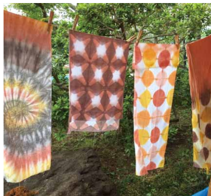
ベンガラ染めの手ぬぐい

輪ゴムや板締め絞りで模様を作り、その型と色を自由に組み合わせてオリジナルデザインの