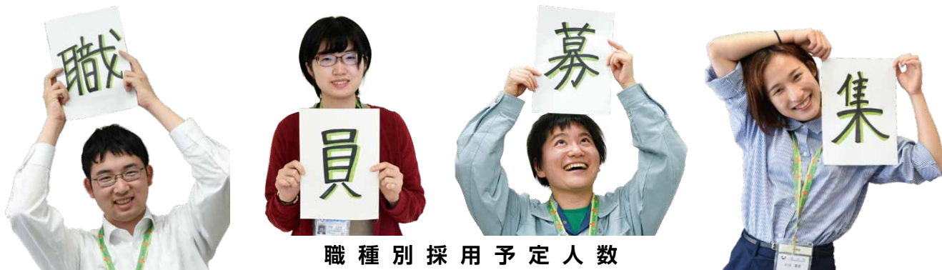
職種別採用予定人数

令和元年度山武郡市職員合同採用試験を次のとおり行います。受験の申し込みは、1参加団体1職種に限ります。併願はできませんのでご注意ください。