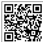
(配信登録用) QRコード