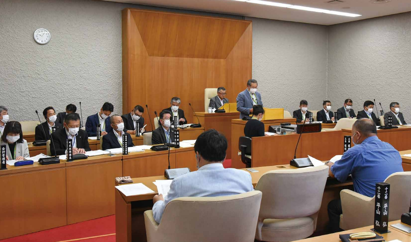
▲議案説明をする相川町長