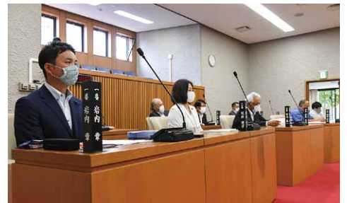
④本会議で常任委員会からの報告があり、採択するかどうかの採決が行われます。