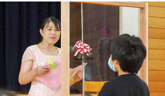
▲万全な感染対策の中、新1年生の入学を祝う会が行われた(6月12日 芝山小学校)

おり採択となりました。 続いて、請願の採択により議員発議において提出された意見書案2件が、全会一致で可決されました。