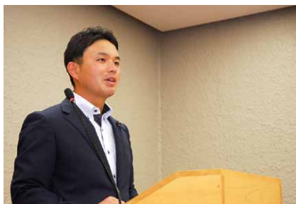
⑤採択された場合、意見書案が朗読され、さらにその意見書案が採決されます。