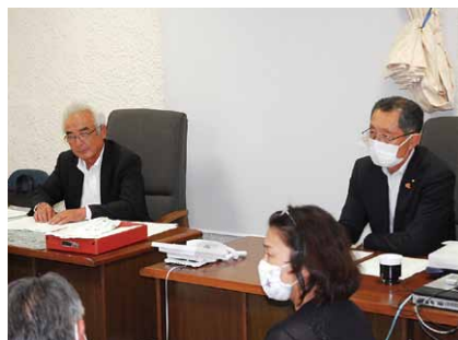
②議会運営委員会で審議されます。