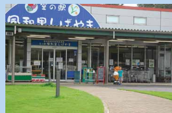
空の駅「風和里しばやま」

行き交う飛行機を目の前で楽しめる「航空科学博物館」や「ひこうきの丘」など、空港南側エリア「スカイパークしばやま」にある地元農産物直売所。