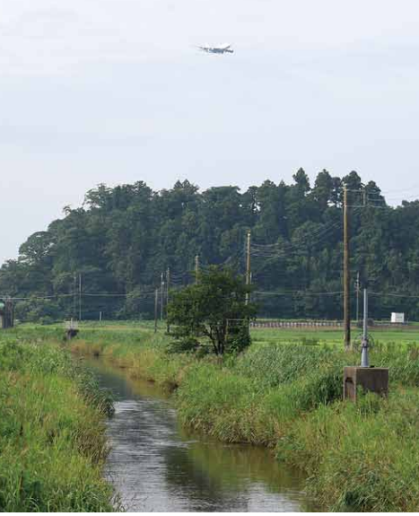
▲機能保障道路として整備される高谷川沿い道路

※町の幹線道路計画策定のため、市内のプロジェクトチームが発足しました。対象となる路線は、はにわ台と川津場地域(国道296号)を結ぶ広域道路の他に、はにわ道と新井田地区を結ぶ小学校前に計画されている道路などです。 空港の事業である高谷川沿いの機能補償道路とあわせて、町の新たな骨格作りがスタートします。