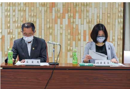
③本会議で所管する常任委員会に付託されます。