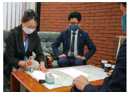
①請願の受付は議会事務局で行われます。