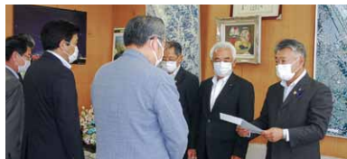
▲議員の同意を受け即日町長に要望書を提出

令和2年7月1日から令和2年9月30日までの3か月間、議会の議員の議員報酬を10%減額する。3か月間の減額合計額81万600円。