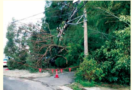
▲昨年台風15号襲来時の被害の様子

ビニールやトタン、樹木などが電線に引っかかると 長期間の停電の原因 になる場合があります