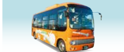
ふれあいバス 芝山千代田駅とJR松尾駅(山武市)を結ぶ路線です。