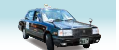
あいあいタクシー 芝山町にお住まいの方がご利用いただける乗合タクシーサービスです。