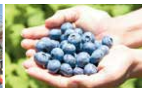
ブルーベリー狩り(7~8月)