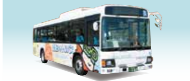
空港シャトルバス 横芝屋形海岸と成田空港を結ぶ路線です。