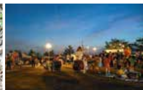
芝山ホテル夏祭(7月)