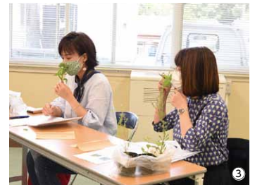
① 埴輪についての講義を聞く学級生の皆さん（5月28日、生き甲斐学級開講式） ② さまざまな運動を行いました（6月3日、アルファベックス講座） ③ ハーブの香りに癒される様子（6月18日、はじめてのハーバルライフ講座）