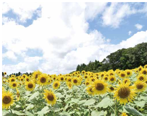
▲町内に咲く鮮やかなひまわり