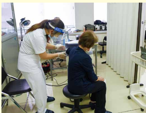
▲昨年度実施された様子

令和3年度も事前予約制で実施します。予約方法は、広報しばやま12月号に掲載します。