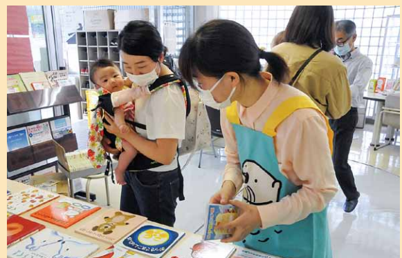
▲たくさんの絵本が並びます（9月22日）

乳児健診や赤ちゃん相談などに来られた親子に、読み聞かせ用の絵本をプレゼントしています。子どものためにお気に入りの絵本を選ぶお母さんの顔からは、自然とやさしさや笑顔がこぼれます。