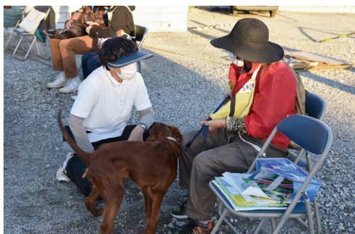
▲日常生活での疑問を相談する様子

参加者の皆さんは、日常生活の中でよく使われるハウストレーニングやトイレの相談など、愛犬との生活をより快適にするためのさまざまな知識を学びました。