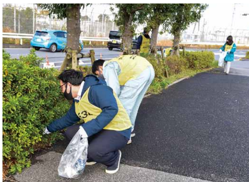
▲クリーンアップ運動の様子

参加者の皆さんは、瓶、缶、ペットボトル、可燃物、不燃物など、さまざまなごみを拾い、空港周辺の美化に取り組みました。