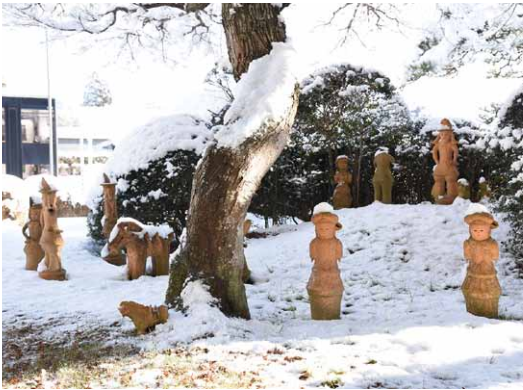
▲はにわたちもすっかり雪化粧（1月7日）