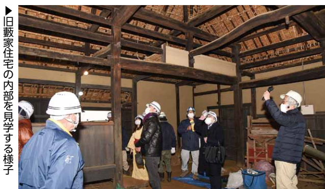
▶旧藪家住宅の内部を見学する様子

先人から伝わる知恵や工夫に感心し、職人さんの技術を間近で感じる事ができた貴重な一日。この体験を通して、あらためて古き良き建造物の素晴らしさを実感しました。