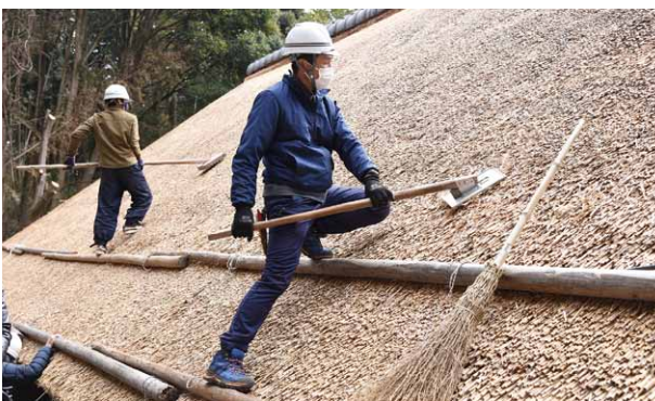
▶茅葺屋根の修理作業の様子