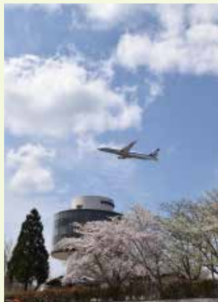
桜色の空に飛び立つ飛行機

A 町内41ヶ所の大規模盛土に対し、令和4年度予算で計画策定する予定でしたが、執海市の大規模盛土流失事故を受け、国は前倒しで令和3年度に予算措置したため、本町においても今回、補正予算措置し、対策を推進します。