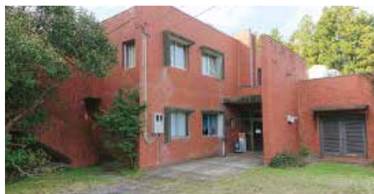
老朽化の進む公共施設

答 【町長】 住民アンケートなどによる利用ニーズの調査や民間企業の活用、自治体施設との広域連携等も考慮し、まずは必要性の検討からなると思います。