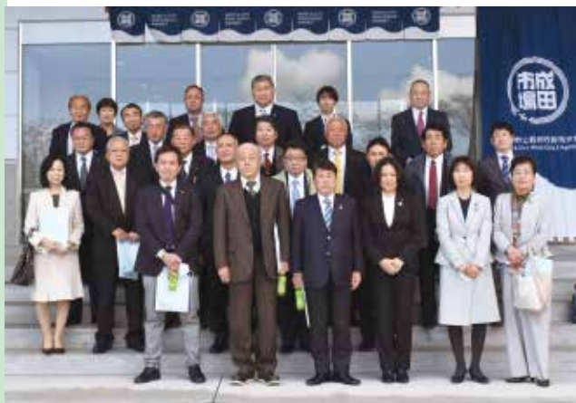
新生成田市場正面玄関にて。芝山・多古町両町議員が揃い、2年ぶりの研修視察となった。

日本初の「ワンストップ輸出機能」を持つこの市場では、衛生管理が徹底された閉鎖型施設内で、すべての輸出手続きができるため、新鮮な状態で日本の農水産物を世界の食卓に届けることができます。今後、一般向けにも新鮮な食材が購入できる関連施設建設も予定されています。芝山町の農産物生産者にとっても、大いに期待が持てる施設となりそうです。