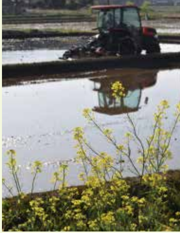
田んぼの代掻きを眺める菜の花

A 法律上可能になるのはデータ保存のみで、通信上のセキュリティ問題はありません。