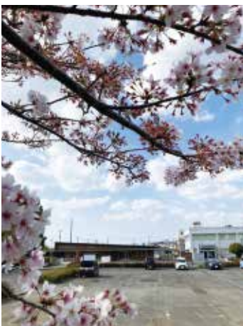
オープン間近の、新設子育て支援センター

答 【町長】現在もブックスタート事業や読み聞かせなどをしています。幼児教育という観点から見ても、非常にいいことだと思っております。今後の更なる取り組みを検討します。