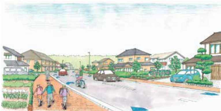
町道3BL-0095号線沿道のイメージ