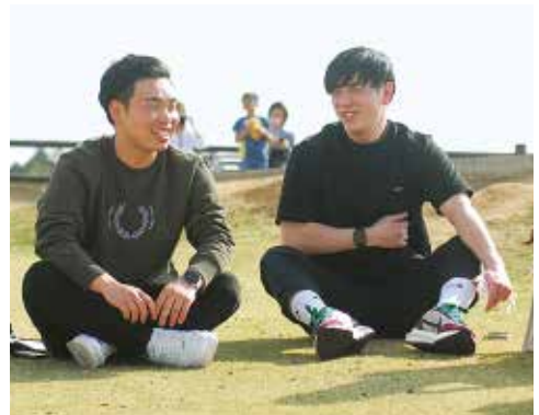
友達が集まる場所は、友人の家が多い現実

「自然を生かしたグランピングと夜空に輝く星空観賞」 「自然を生かしたグランピングと夜空に輝く星空観賞」 「自然を生かしたグランピングと夜空に輝く星空観賞」