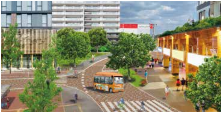
【スカイゲート拠点駅前整備イメージ】