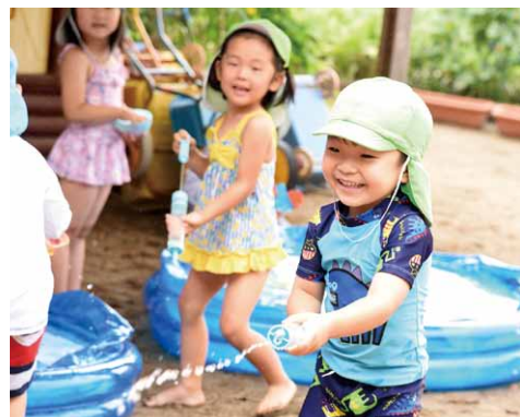
▲水遊びの様子（第二保育所）

・受給者が婚姻した（事実婚を含む）、児童を養育しなくなったなど、受給資格がなくなっているにも関わらず届出をしなければ、手当の不正受給となり、手当を返還していただきます。