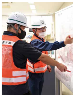
▲災害情報収集体制

自治振興係は、町民の方が安心して生活を送れるように、消防・防災を中心に多様な業務を行っています。 主な業務内容は、消防団、消防委員会、地域防災計画および防災会議、防災行政無線、災害対策、区長会、地縁による団体、交通安全対策、防犯などの業務です。